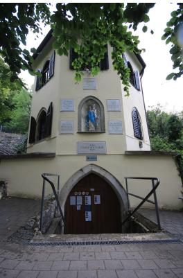
Bild 1: Eingang zur Tropfsteinhöhle Schulerloch (Schauhöhle). Darüber befindet sich ein kleines Museum