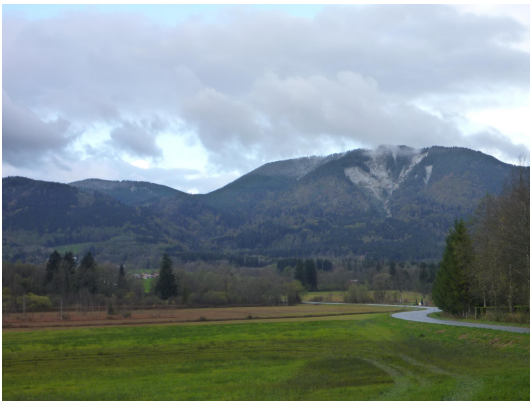
Bild 1: Im Bildzentrum kommt aus den Bergen die Rinne des Lahngrabens, dort setzt der Fächer an.