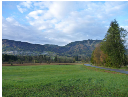
Bild 2: Am Fuß der Berge der bewaldete Mur-Schwemmfächer von Grafenaschau