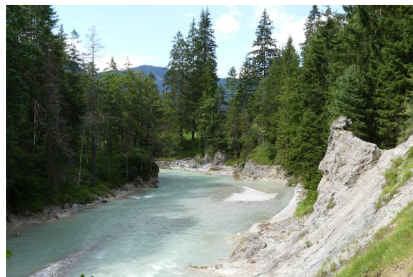
Bild 4: Rißklamm unterhalb des Zusammenflusses von Riß- und Fermersbach