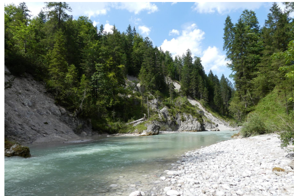
Bild 2: Rißklamm oberhalb des Zusammenflusses von Riß- und Fermersbach