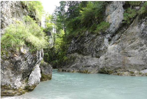
Bild 1: Rißklamm oberhalb des Zusammenflusses von Riß- und Fermersbach