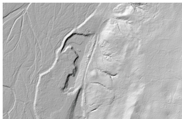
Bild 4: Konturen der früheren Kiesgrube im Digitalen Geländemodell